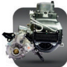
موتور قوى ٢٣٦ سي سي