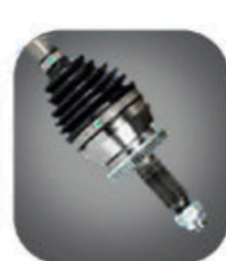
كوبلن قوى لتحمل أقصى حمولة