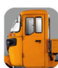
كابينة واسعة للسائق